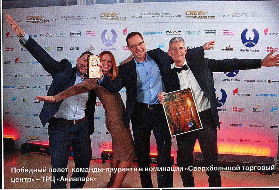
Победный полет команды-лауреата в номинации «Сверхбольшой торговый центр» – ТРЦ «Авиопарк»