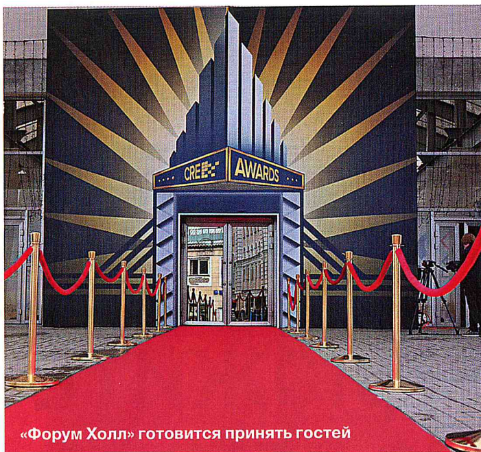
«Форум Холл» готовится принять гостей